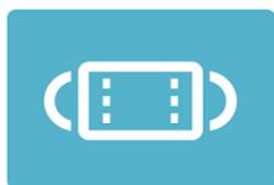
マスクの正しい着用